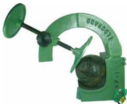
Cód 1614 Máquina Vulcanizar Pneu - Xr1 220V - Unid.