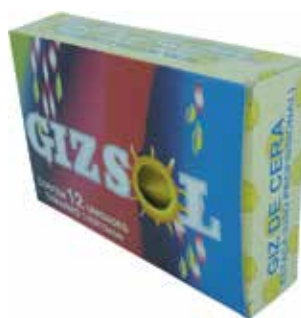
Cód 1403 Giz de Cera cx 12 Unid.