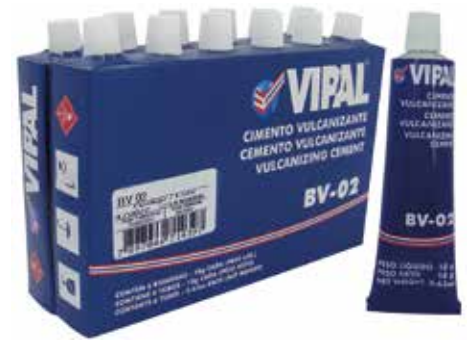
Cód 1136 Cola BV-02 18gr - Unid.