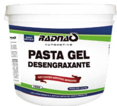
Cód 5704 Pasta gel desengraxante 2,5 kg, cx12X2,5kg