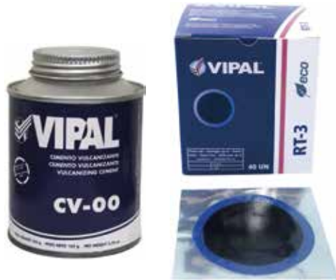
Cód 1141 Cola CV 00 - 163gr - Unid.