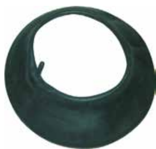
Cód 298 Câmara Carrinho de Mão 3.25 x 8 - Unid.