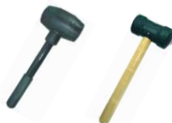
Cód 2004 Martelo de Borracha - Cabo Aço