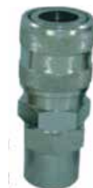
1/2 x 1/2