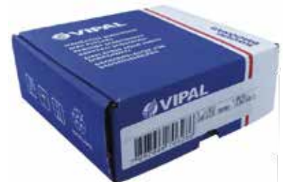
Cód 1297 Tip Top VD 02 - CX 20 Unid.