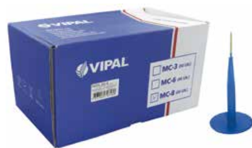
Cód 4189 Refil Vipal MC 08 Com Arame P/ Caminhões