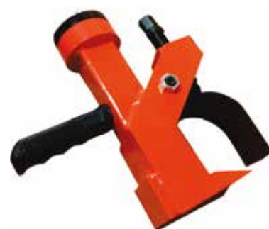
Cód 4603 Deslocador Pneumático de Pneu Unid.