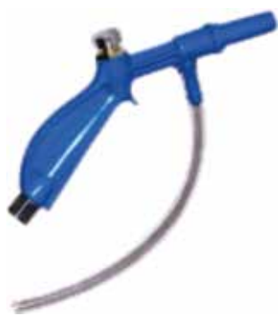
Cód 1523 Pistola Pulverizar /C Gatilho e S/ Gatilho Unid.