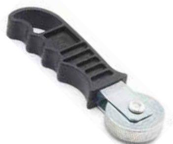
Cód 1139 Rodilho Unid.