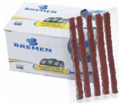
Cód 1719 Refil Bremen CX 60 Unid.