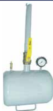
Cód 2392 Assentador Talão Pneu S/ Câmara Unid.