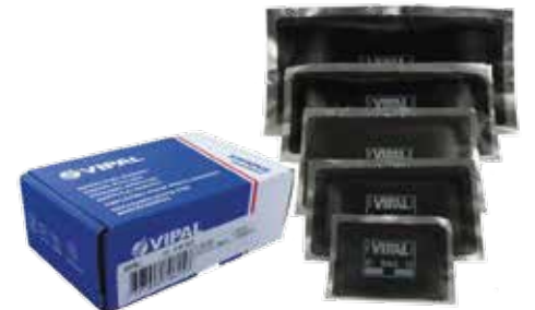
Cód 1304 Tip Top Rac - RAC 10 - CX 20 Unid.