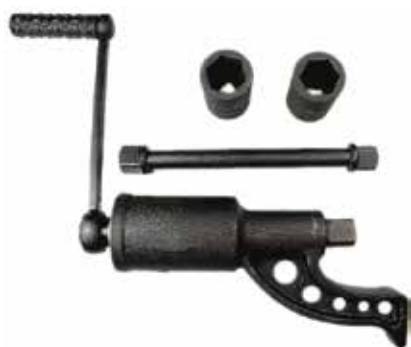
Cód 356 Desforcimetro C/ Soquete 32/33 Unid.