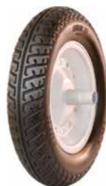
Cód 4408 Roda Carrinho de Mão Completa (Pneu + Câmara) - Unid.