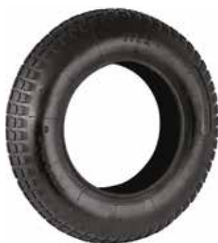
Cód 2583 Pneu de Carrinho de Mão 3.25 x 8 - Unid.