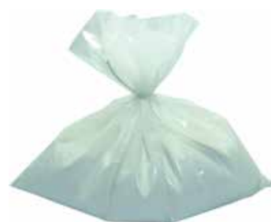
Cód 1600 Talco Branco P/ Borracharia kg