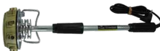
Cód 2287 Marcador Eletrônico de Pneu Unid. Marcador de pneu elétrico com os números de 0 até 9 números Tamanho: 12 x 22 mm Corpo cromado. Aquecimento por resistência tubular blindada 450W. Logotipo pode ser instalado na parte frontal. Voltagem 220 V. Ideal para controle de frotas