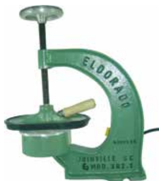
Cód 1589 Máquina Vulcanizar Câmara - Xr2 220V - Unid.