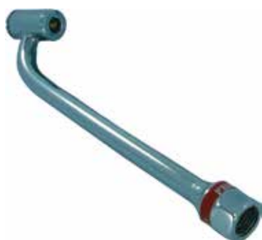
Cód 1151 Bico Duplo Cromado Unid.