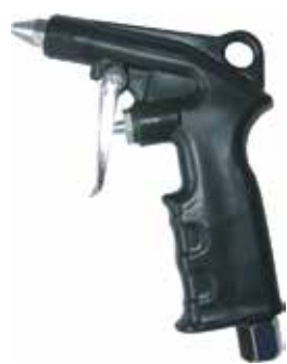
Cód 1522 Bico Soprador P/ Limpeza Unid.