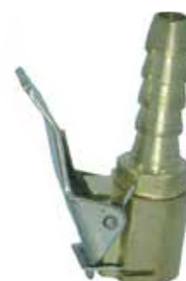
Cód 1720 Bico Prendedor Tipo Francês Unid.