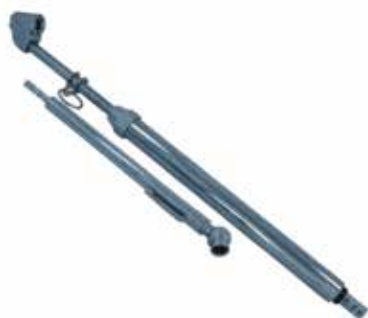
Unid. Cód 1157 Calibrador de Pressão - 50 lbs. Cód 1158 Calibrador de Pressão - 150 lbs.