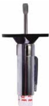
Cód 4413 Profundimetro 0-25 mm Unid.