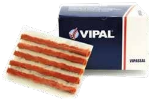
Cód 1134 Refil Vipaseal CX 60 Unid.