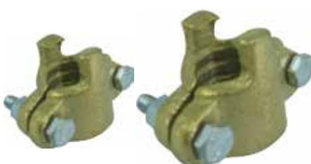
Abraçadeira Latão / Unid.