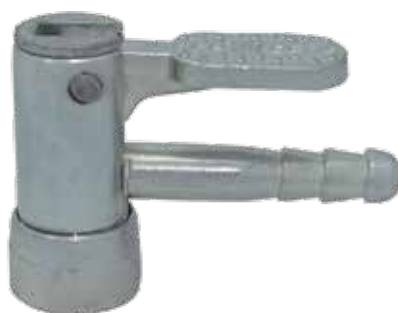
Cód 2088 Bico Prendedor Haste Metal Unid.