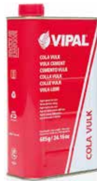
Cód 1142 Cola Vulk 685gr - Unid.