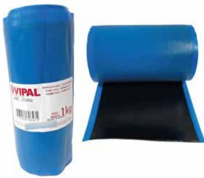
Cód 1150 Borracha Vulk 1kg - Unid.