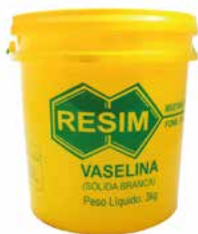
Cód 1058 Vaselina Sólida 3 kg