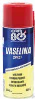
Cód 5266 Vaselina Spray cx12X300 ml.